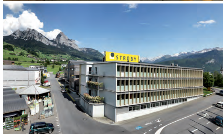
Verwaltungsgebäude der Strüby Holding AG, Seewen. Administration building of Strüby Holding AG in Seewen.