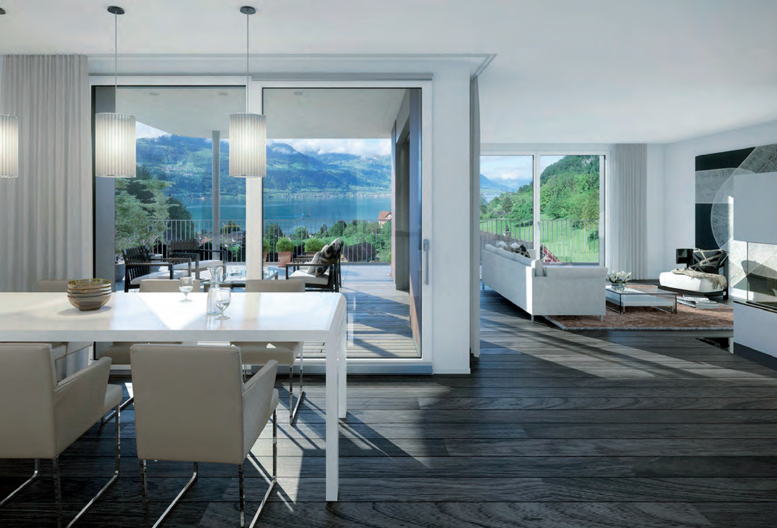
Wohnbauprojekt Tirano der Strüby Konzept AG. Modernes Wohnen in mediterranem Umfeld von Gersau. Strüby-Konzept AG's Tirano residential project – modern living in the Mediterranean atmosphere of Gersau.